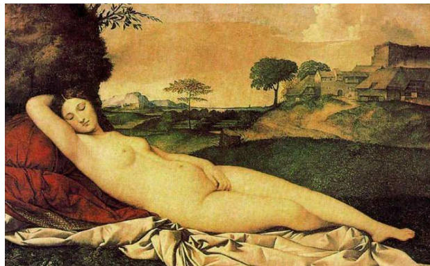
La Venus adormida de Giorgione