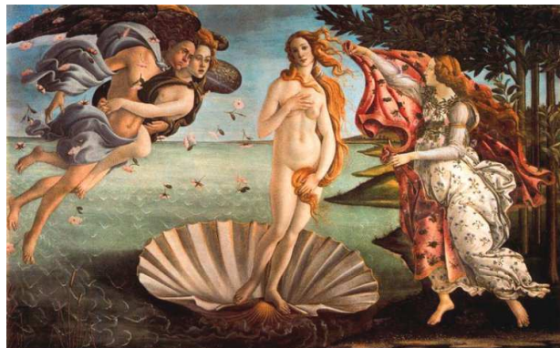
El naixement de Venus de Botticelli