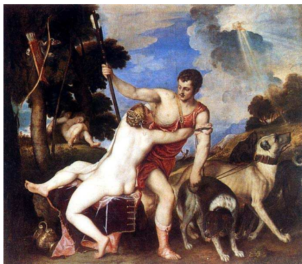
Venus i Adonis de Tiziano