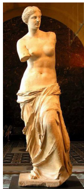
La Venus de Milo

3. Busca pintures i escultures que representen la deessa Venus.